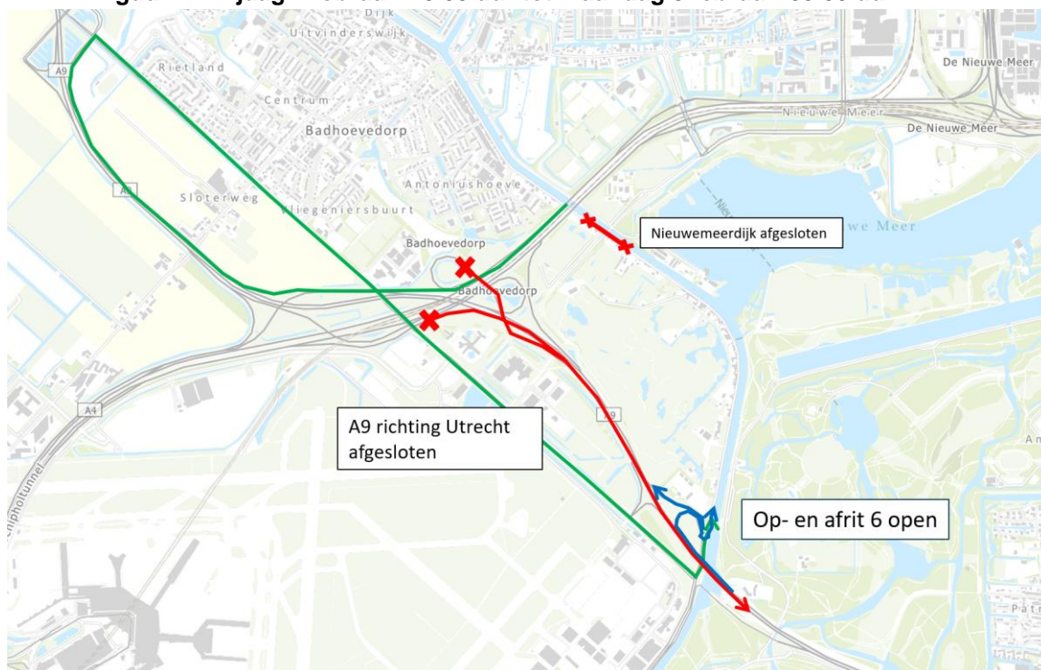
Figuur 1: Vrijdag 2 februari 20.00 uur tot maandag 5 februari 05.00 uur: