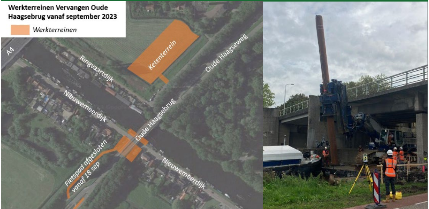
Eerste funderingspalen gaan de bodem in.