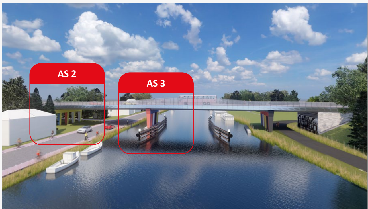
Artis Impression van de nieuwe brug. Hierop aangegeven as 2 en as 3.

Op vrijdag 6 oktober zijn we gestart met het plaatsen van de eerste funderingspalen van de nieuwe brug. Wij bouwen alvast een deel van de nieuwe brug. Wij boren met een stalen buis een gat in de grond. Deze buis bestaat uit meerdere delen die aan elkaar worden gelast en is in totaal zo'n 18 meter lang. Dit doen wij eerst vanaf het water voor de fundering van de poer en kolommen die hier komen. Dit is as 3 op de afbeelding. Vanaf eind oktober brengen wij de palen aan op het land, naast de Nieuwemeerdijk onder de brug. Dit is as 2 op de afbeelding. Als alle holle stalen buizen zijn geplaatst, brengen wij wapening aan en vullen ze de buizen met beton. Dit gebeurt in november en december. Op deze manier maken we een sterke fundering voor de poeren, kolommen, de liggers en het brugdek.